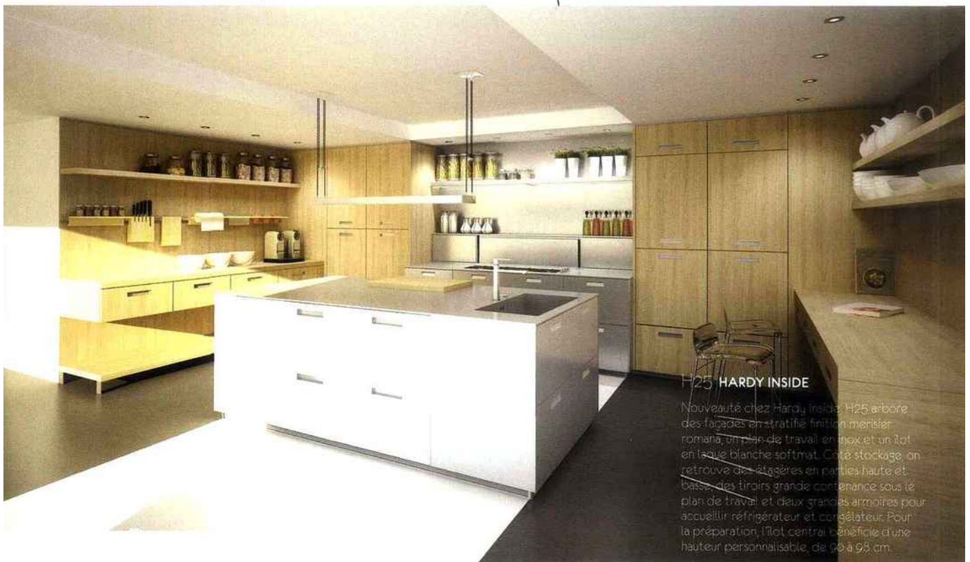
H25 HARDY INSIDE

Du bois, de l'inox et de la pierre reconstituée, voici le trio gagnant de cette composition du fabricant espagnol Docca. Chaleureuse, elle est pensée pour s'inviter au mieux dans un espace ouvert vers le salon.